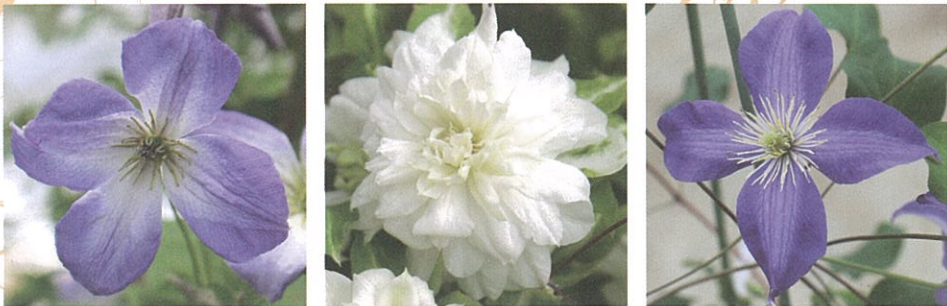
マリア・ラグーン (オリジナル品種) 庭のよこび (オリジナル品種) ブルーブルー (オリジナル品種)

キンポウゲ科クレマチス属のつる性植物。世界に自生する原種は300種とも言われ、花色、花形が様々にあり、早春から冬まで1年を通じて何かしらの花が楽しめる。鉢植えや庭植えで楽しむことができ、近年ではバラや宿根草と合わせて楽しむ人が増えている。